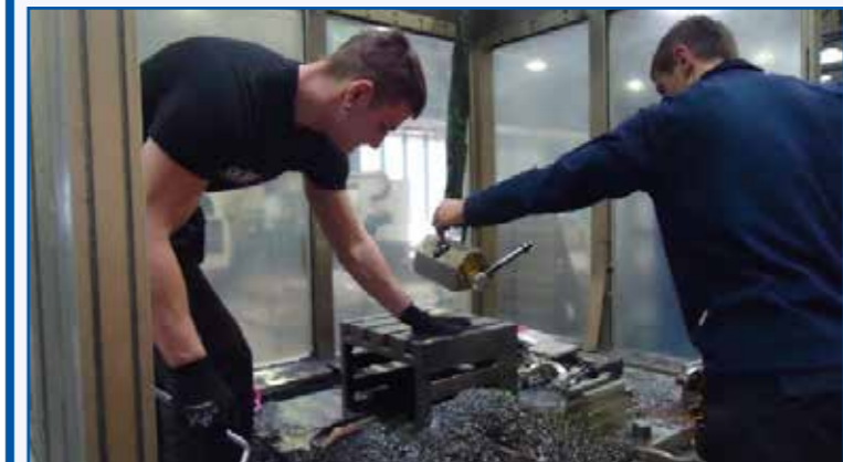
Analyse: Rüstzeiten (SMED)