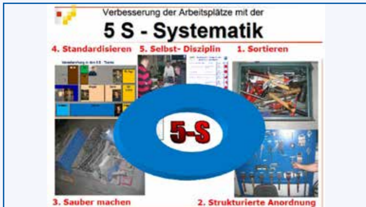
Analyse: 5 S - Systematik